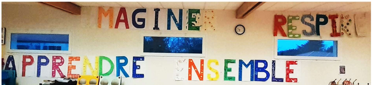
Des mots pour le dire et le vivre : à l'école Ste-Marie, on est tous : Mobiliser pour Apprendre, Respirer, Imaginer, Ensemble

Tous les acteurs de l'école - réflexions au sein des classes, sondage mené par le Conseil des délégués de classe, concertations avec l'équipe enseignante et ASEM, réunions avec l'OGEC/APPEL - ont été sollicités et mobilisés pour donner leurs avis sur les 3 axes ci-dessous :